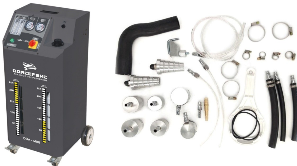
Рис. 1 Комплектация установки